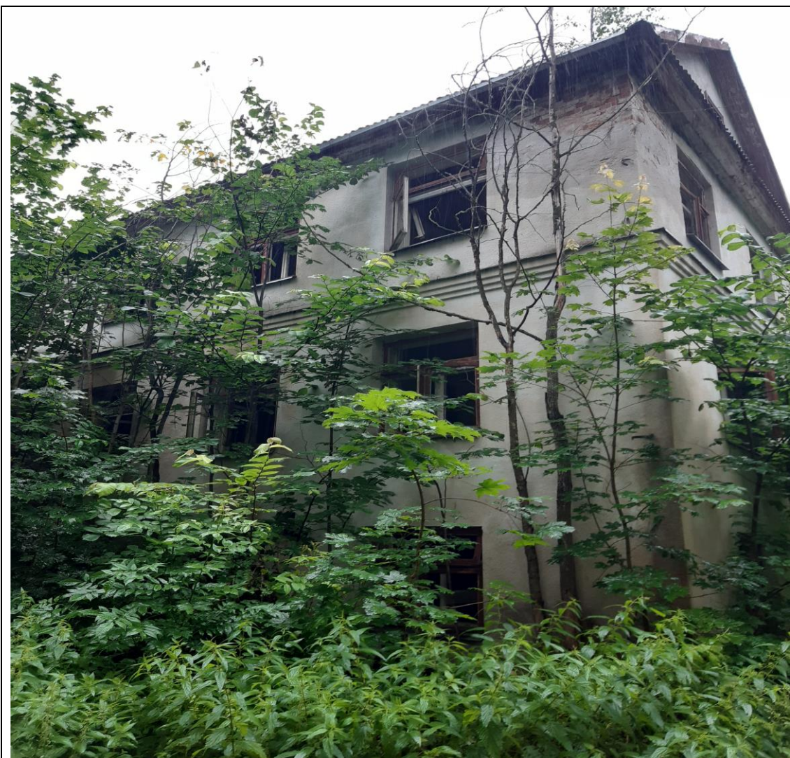
Kultūros vērtības kods 939